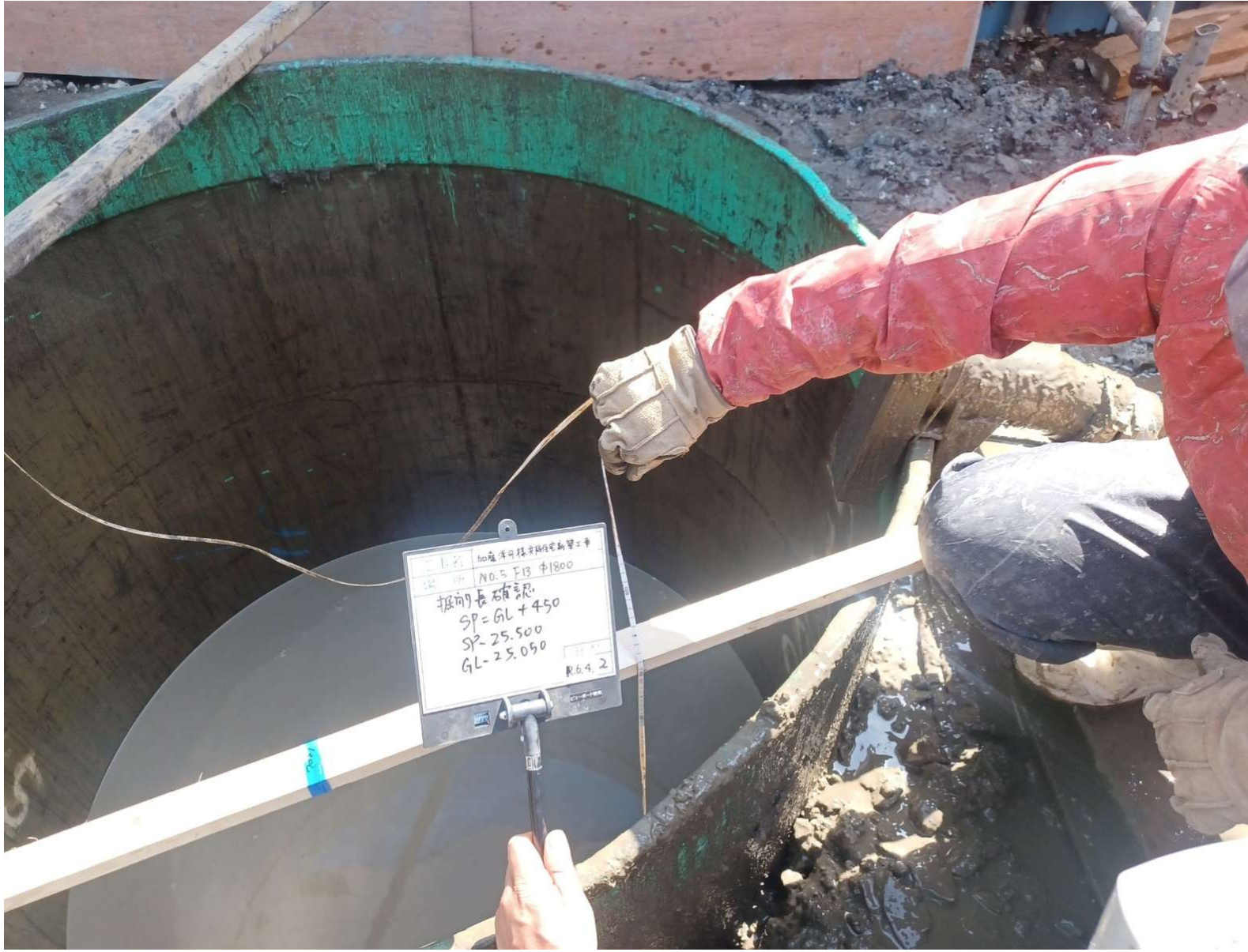
掘削長（支持層到達）確認／2024年4月撮影