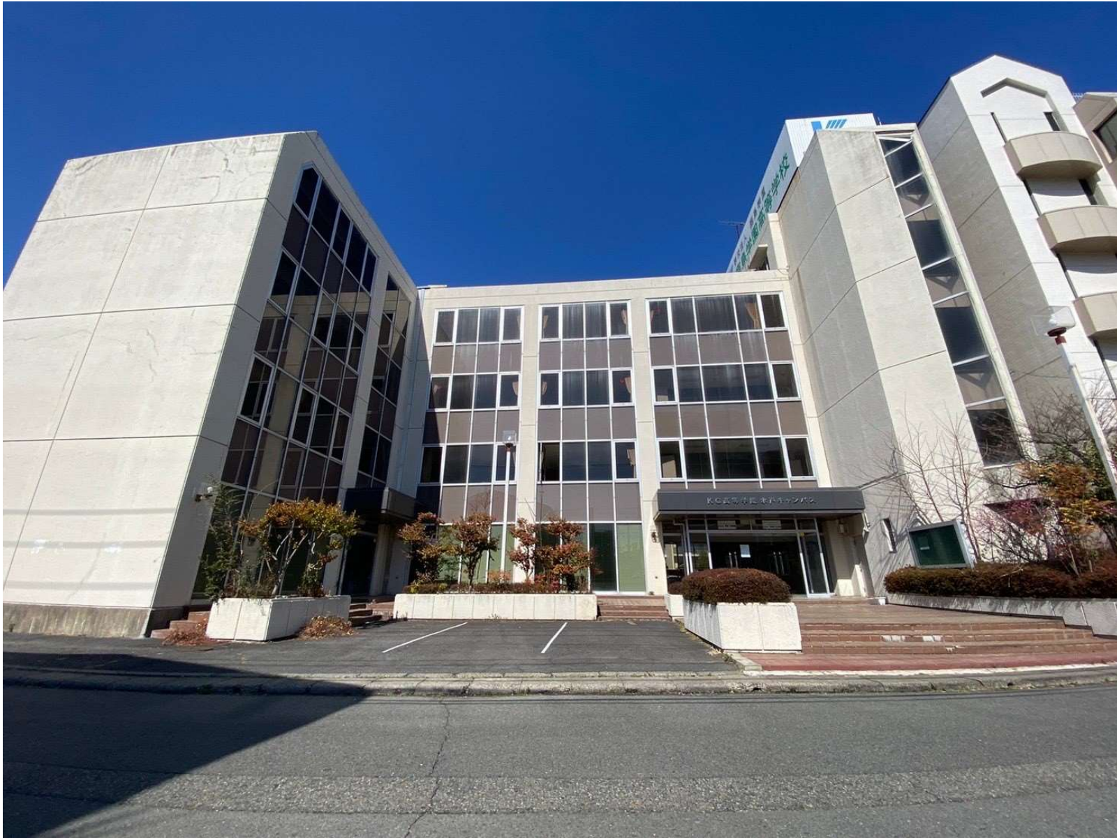
水戸市桜川二丁目ビル（旧学校／新築マンション建設計画地）