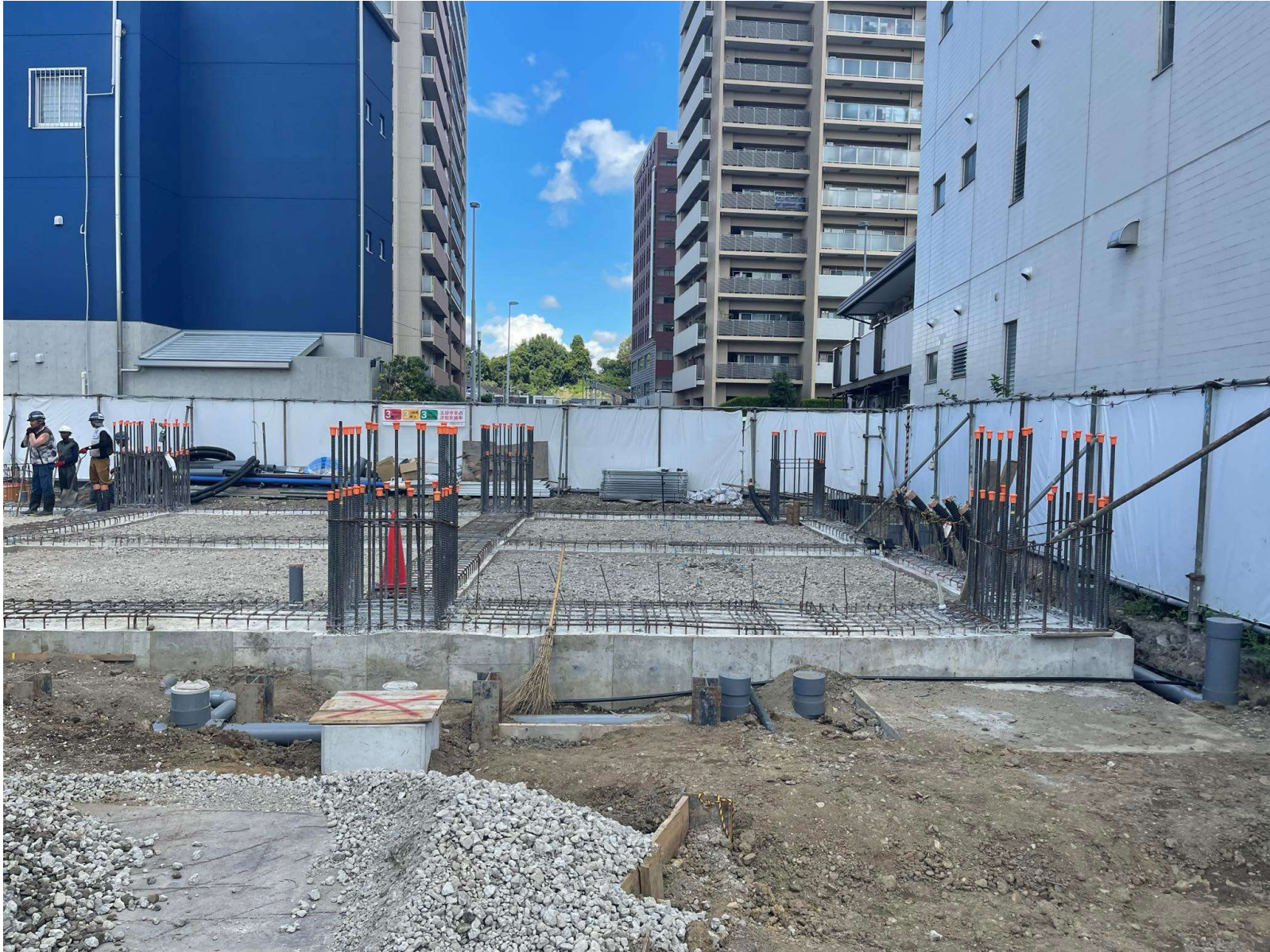
基礎立上り 1階床 / 2024年9月撮影