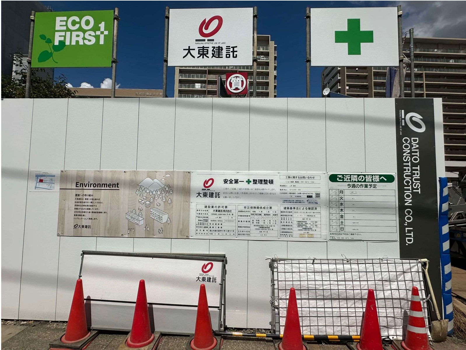
建築確認済表示板 / 2024年9月撮影