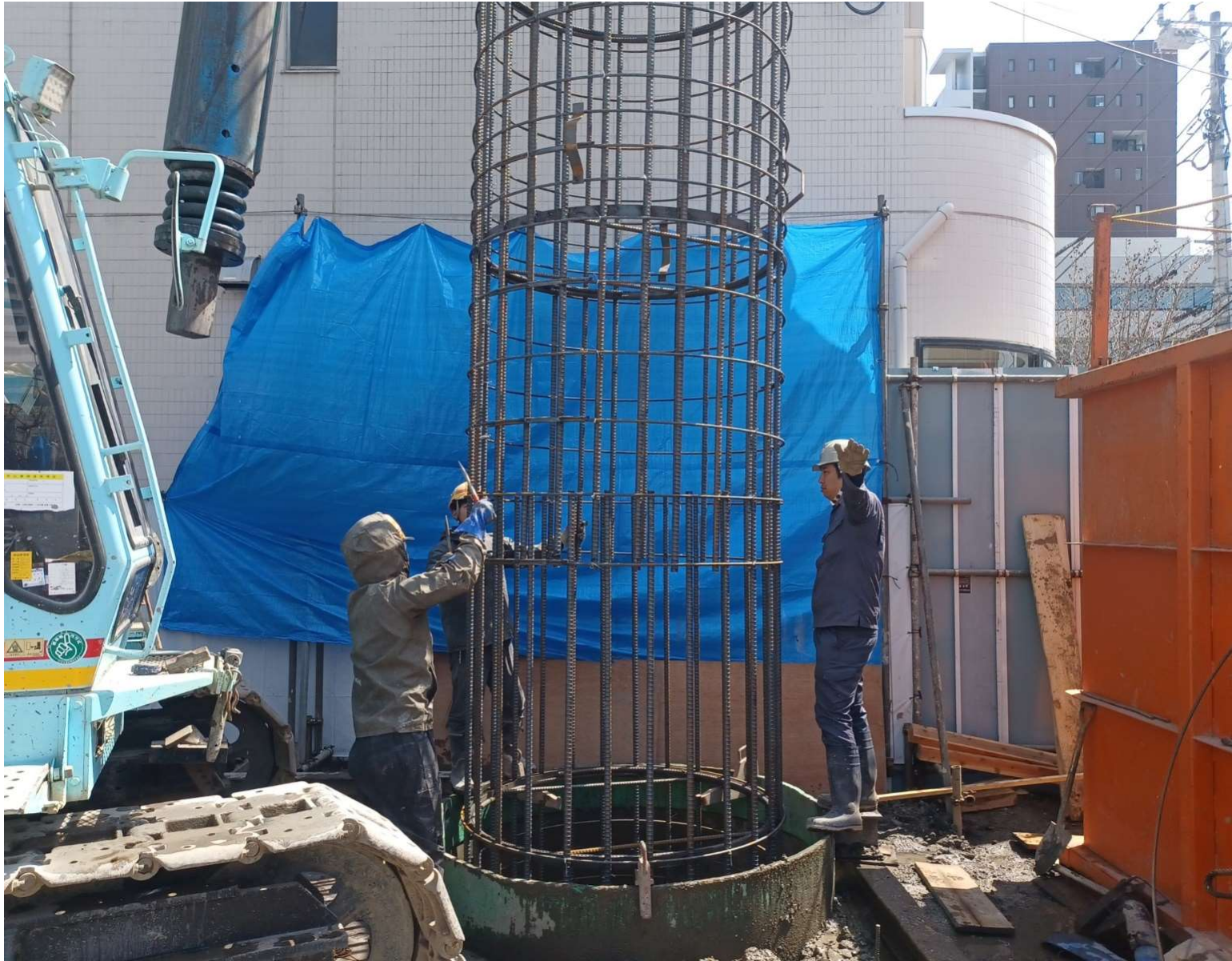
鋼管杭・地盤改良工法／2024年4月撮影