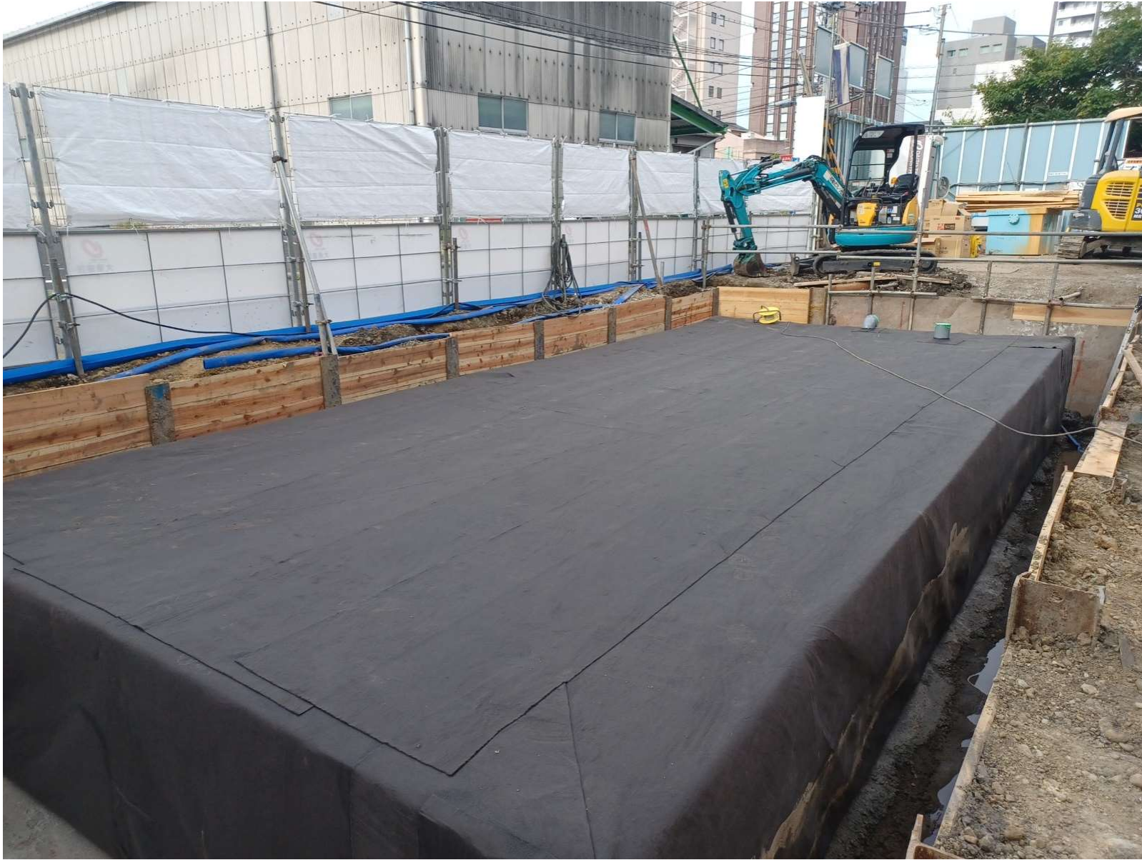
貯留槽新設工事／2024年8月撮影