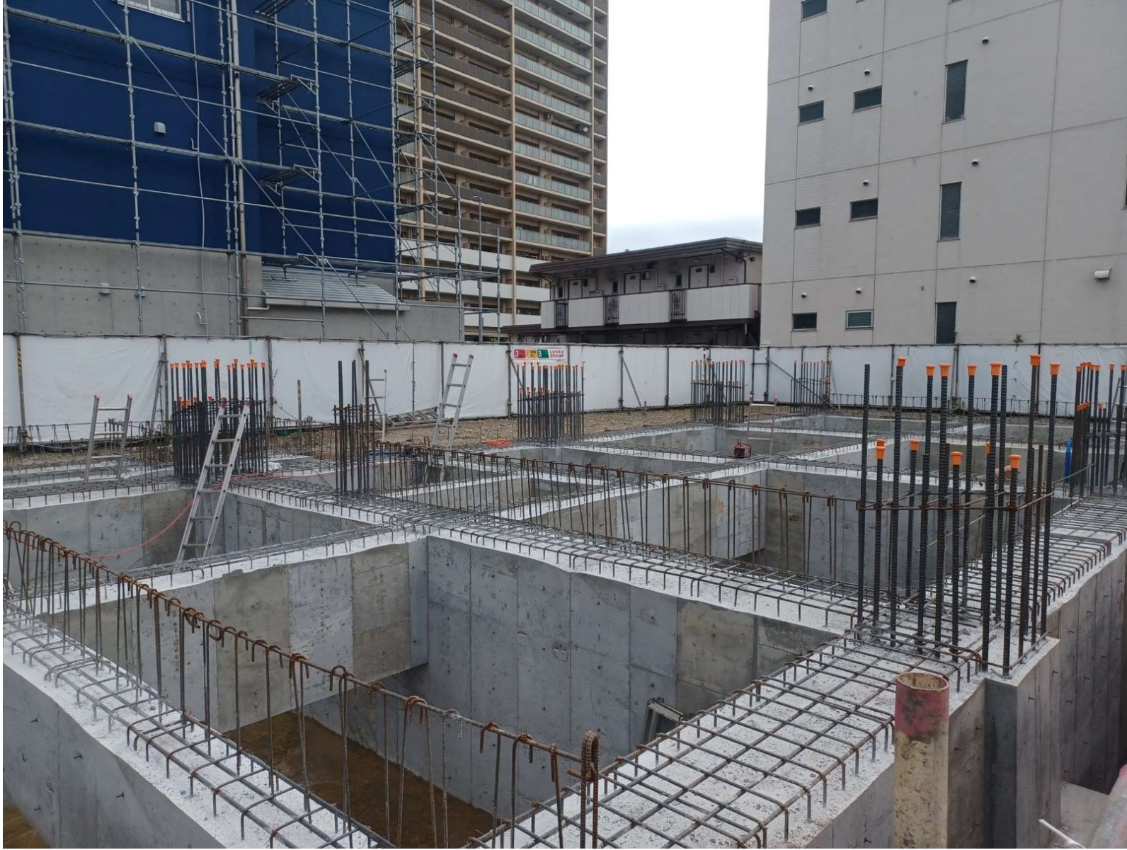
型枠工事／2024年8月撮影