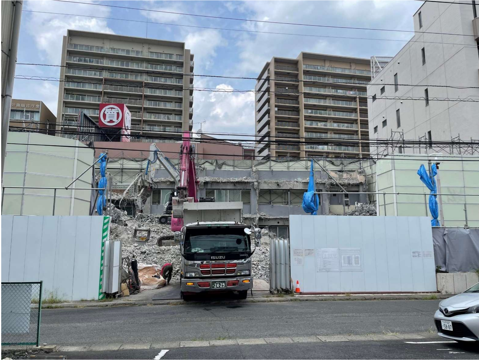
解体工事／2023年6月撮影