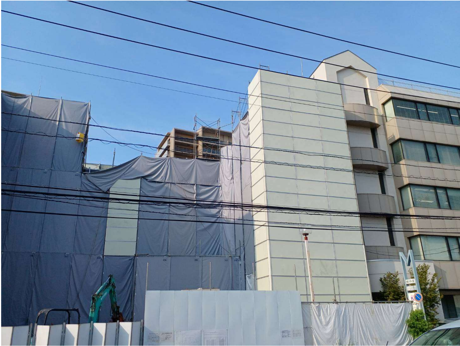
解体工事／2023年6月撮影