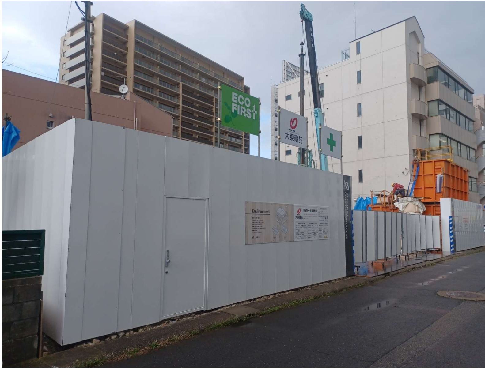
本体着工／2024年4月撮影