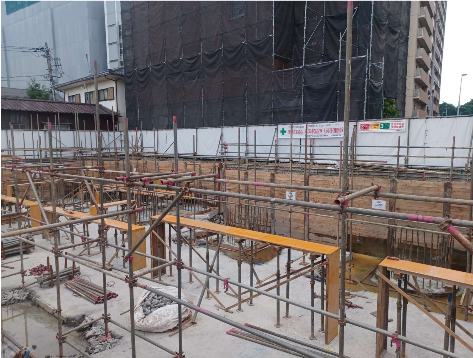
杭頭処理・補強・地下室防水工事／2024年7月撮影