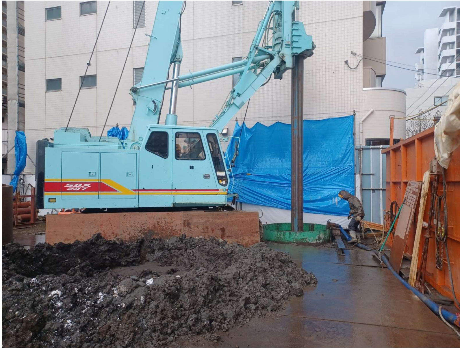
杭基礎工事／2024年4月撮影