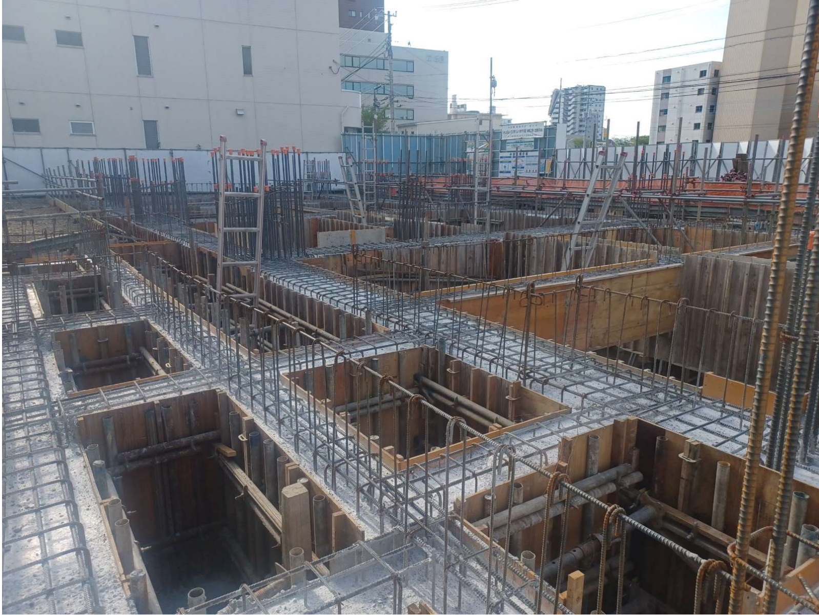
型枠工事／2024年8月撮影