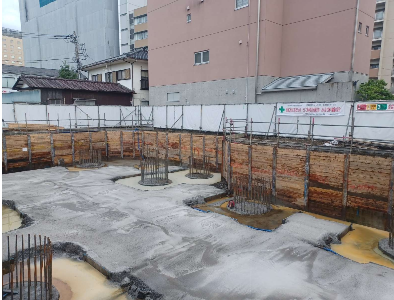
レベルコンクリート打設／2024年6月撮影