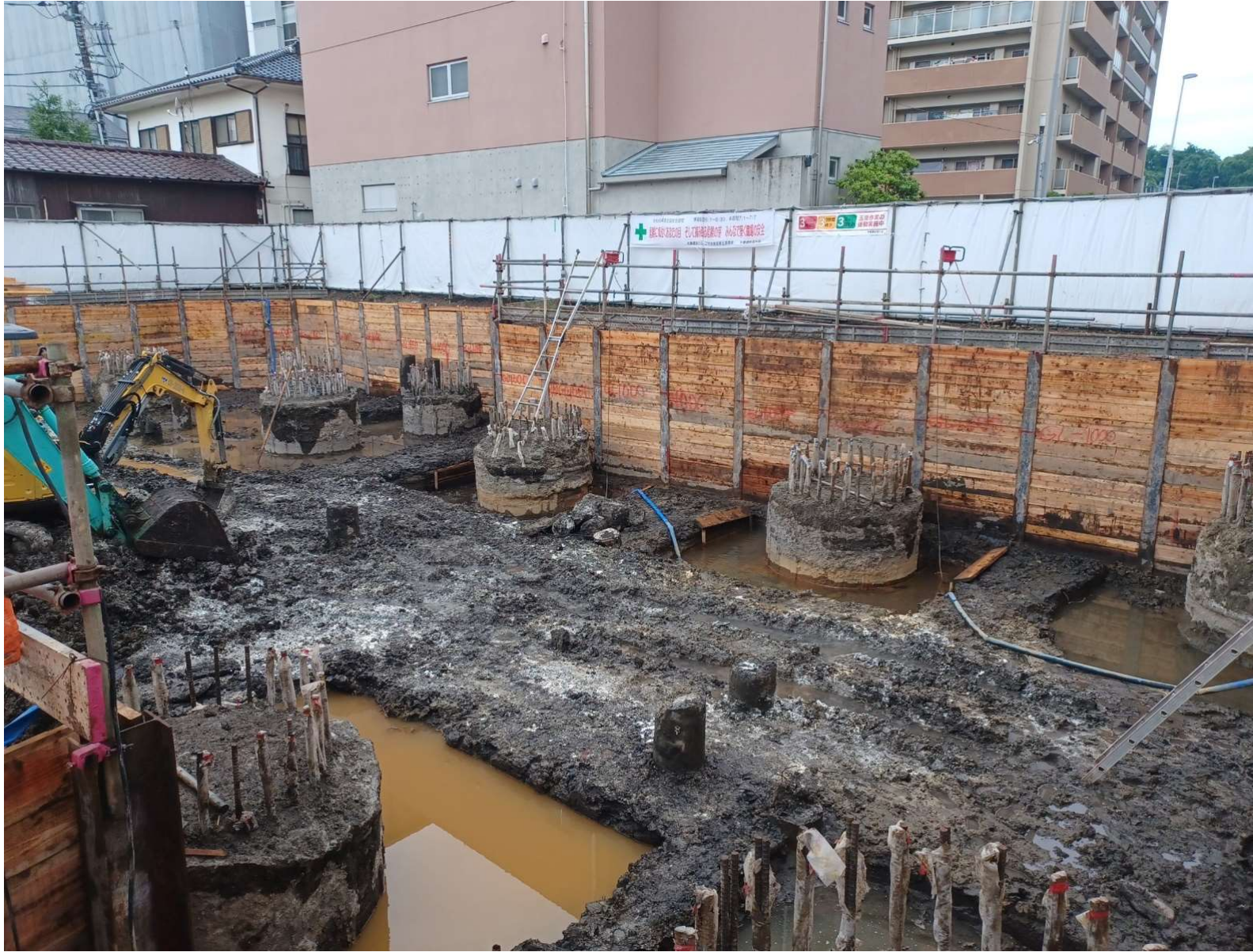
山留・根伐工事／2024年6月撮影