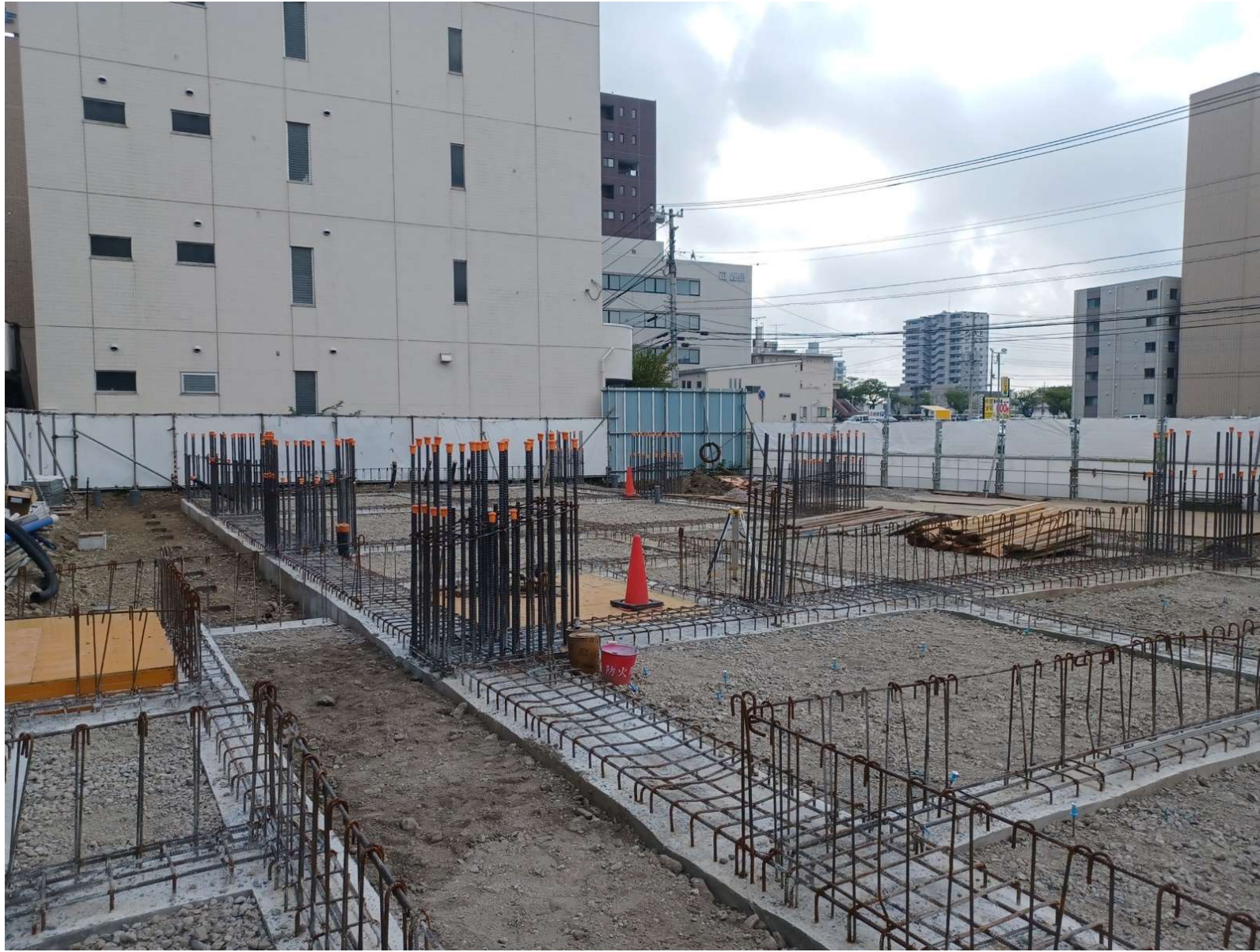
基礎立上り1階床コンクリート打設／2024年9月撮影